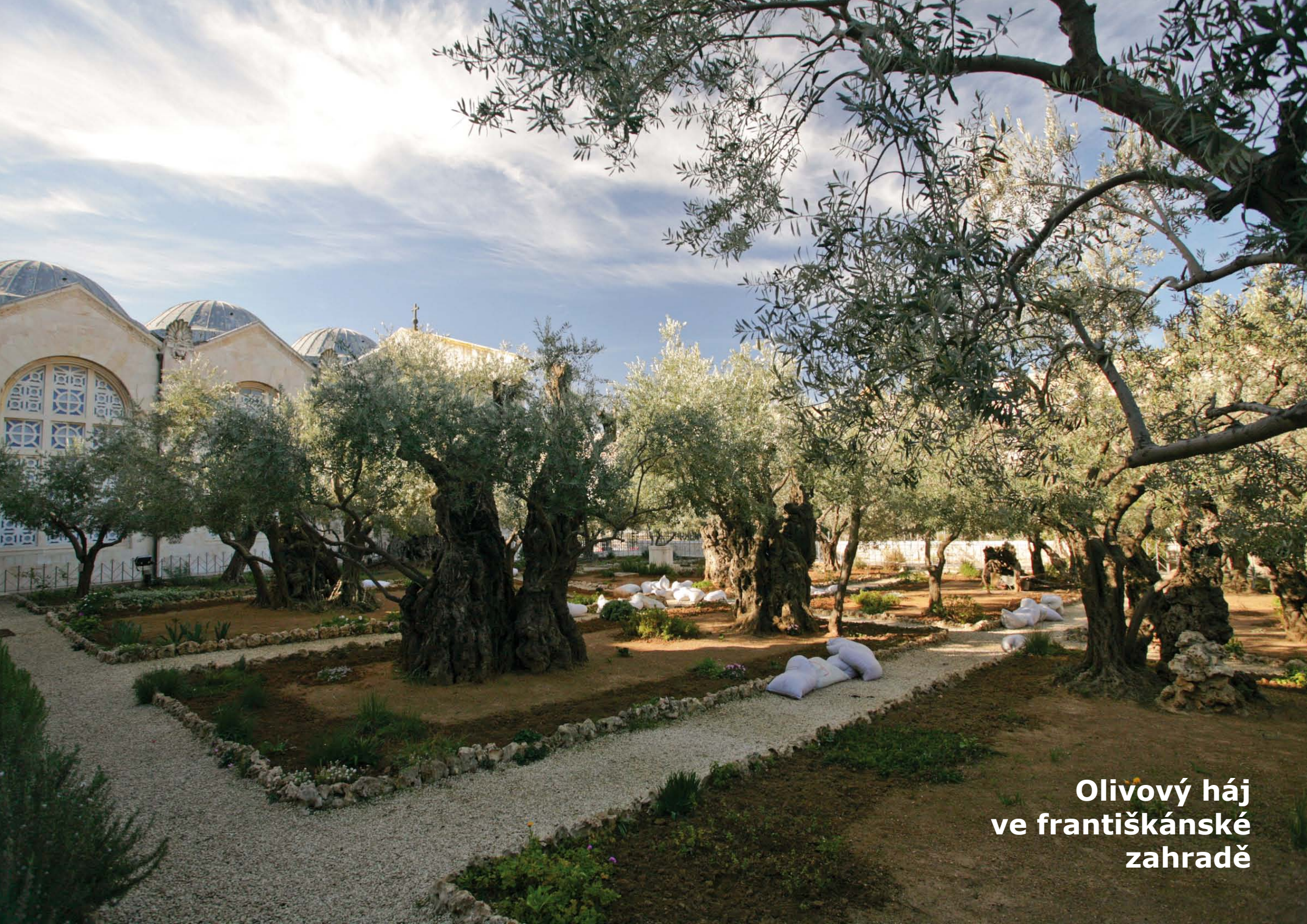
Olivový háj ve františkánské zahradě