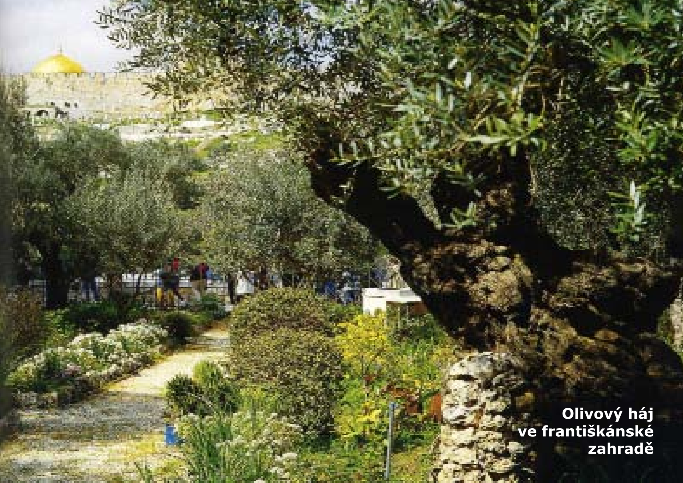
Olivový háj ve františkánské zahradě